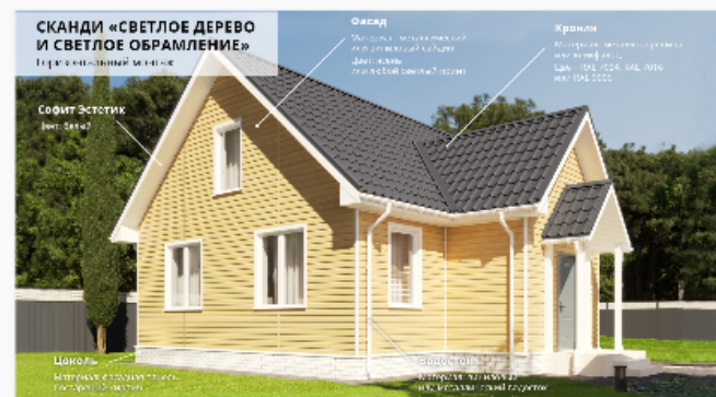
Светлое дерево и белые элементы Горизонтальный монтаж

Учитывайте архитектуру при выборе цветовых сочетаний.