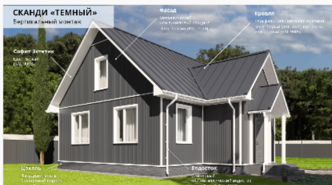
Темный Вертикальный монтаж