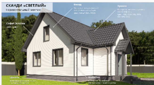
Светлый Горизонтальный монтаж