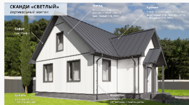
Светлый Вертикальный монтаж