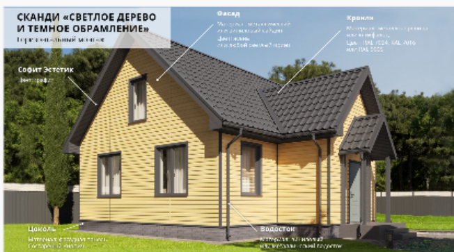
Светлое дерево и темные элементы Горизонтальный монтаж