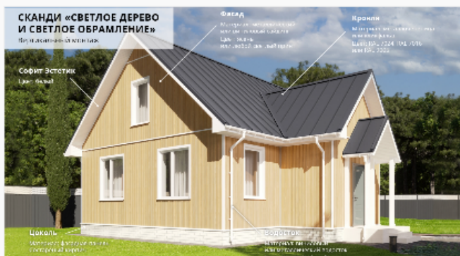
Светлое дерево и белые элементы Вертикальный монтаж