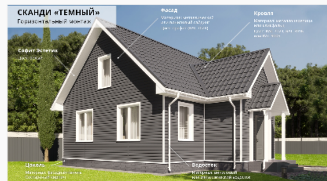
Темный Горизонтальный монтаж