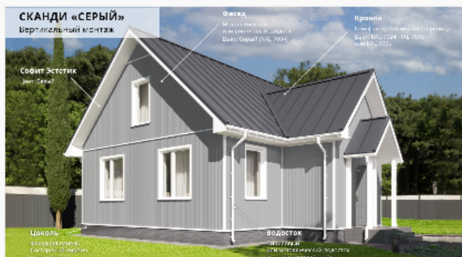
Серый Вертикальный монтаж