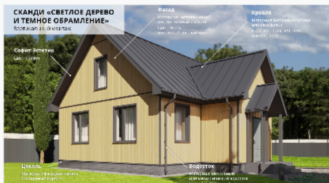
Светлое дерево и темные элементы Вертикальный монтаж